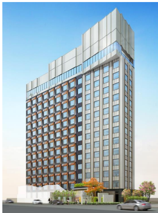
完成予想イメージ ※今後、変更となる場合がございます。

三井不動産グループは、今後も首都圏や全国の主要都市において積極的に新規展開を行ってまいります。