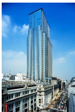
日本橋三井タワー(東京都中央区)