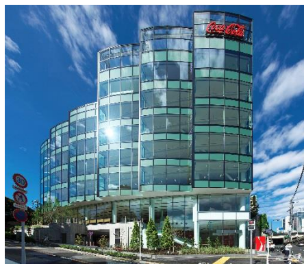
日本コカ・コーラ新本社ビル(東京都渋谷区)