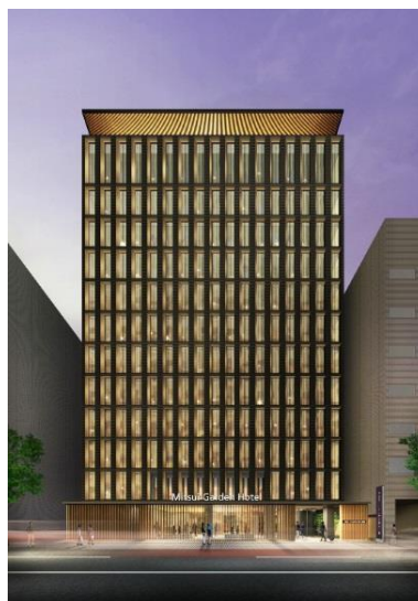
三井ガーデンホテル金沢 (完成予想パース)

今後も大都市圏や地方政令指定都市を中心に積極的に新規展開を行うとともに、ワンランク上の宿泊主体型ホテルとして「お客様の五感を満たすホテル」、「記憶に残るホテル」を目指し、ホスピタリティ溢れるサービスの提供に努めてまいります。