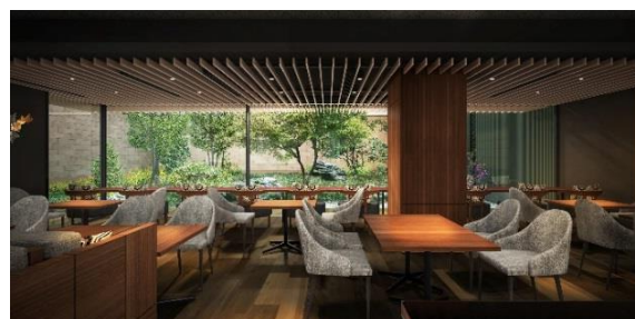
レストラン・庭園