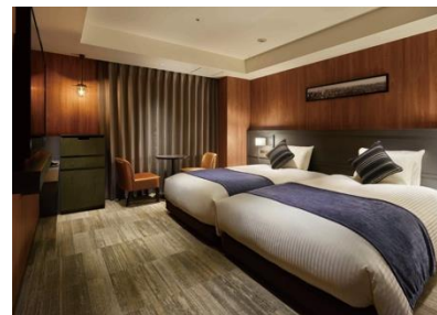
客室(スーペリアツイン)