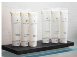
アメニティ「スンダリ」

また、館内では、柚子やカボス・檜など日本独自の植物を調合したオリジナル天然アロマオイルの香りでゲストをお迎えるほか、一部の客室では、厳選された植物原料を配合したニューヨークのスキンケアブランド「スンダリ」のアメニティをご用意し、心身ともに安らいでいただけます。