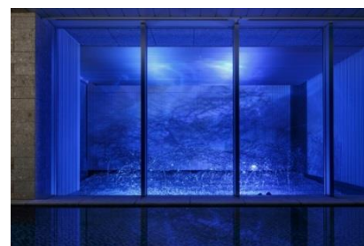
大浴場(SPA)アート「Cloud/雲海」

18階には、旅の疲れを癒す宿泊者専用の大浴場を備えています。坪庭には雲海をモチーフにしたアートを設置し、朝は朝日を反射し清涼感のある空間、夜はブルーのライトに映し出された幻想的な空間と、時間帯ごとに異なる表情をお楽しみいただけます。また、女性用大浴場には、星の瞬きをイメージしたライトを配した清潔感と上質感にこだわったパウダールームを備え、湯上がりにゆったりとお寛ぎいただけます。