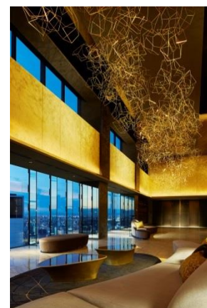
ロビーアート「Golden Cloud/黄金雲」

ロビーや大浴場、客室エレベーターホールに設置しているアートは、愛知県常滑に拠点を置きながら世界的に活躍する澤田広俊氏が設立した「スタジオサワダデザイン」が手掛けています。「天空のプレミア」ならではの、雲や星をイメージしたオリジナルアートです。国内外のハイエンドホテル・レストラン・ブティックでアートデザイン・製作を手掛ける「スタジオサワダデザイン」の作品は、愛知に根ざしているからこそ表現できる、まさに新しい名古屋のセンス・オブ・プレイスを表すアートとなっています。