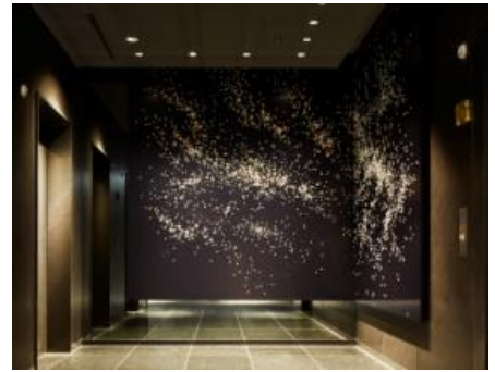
客室(18階)エレベーターホールアート 「Galaxy/銀河」

夜空に浮かぶ無限の銀河をイメージ。ひとつひとつ手作業で打ち込まれた点灯は、見る角度によって色が変わり、奥行き感のある、本物の星のようなアートとなっています。