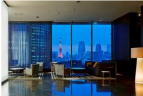
銀座プレミア:ロビー

三井不動産ホテルマネジメントグループは、三井ガーデンホテルズを全国に18ホテル(4,809室)・セレスティンホテルを1ホテル運営しており、2016年に京橋(東京)・名古屋、2018年に日本橋に開業し、グループ運営客室数が5,800室超となる予定です。「記憶に残るホテル」「感性豊かなお客様の五感を満たすホテル」という理念・ホテルコンセプトのもと、デザイン性の高さで機能性を備えた滞在空間に、ホスピタリティ溢れるサービスを提供しています。