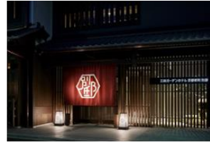
京都新町 別邸:エントランス