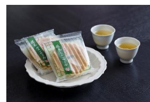
抹茶菓子ヴァッフェル

福寿園の茶匠が厳選した茶葉を使い、香ばしい香りとさっぱりとした渋みのある味わいに仕上げた緑茶です。