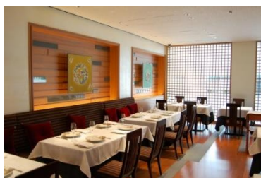
福寿園京都本店3階「京の茶膳」