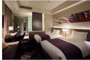
ミレニウム東京:デラックススイート