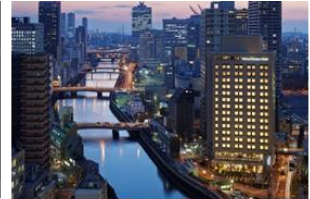
大阪プレミア:外観