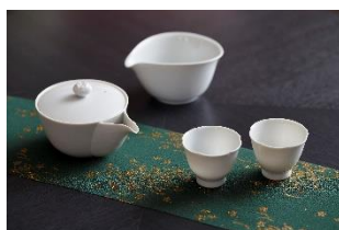
花蕾宝瓶、花蕾湯さまし、花蕾玉露碗