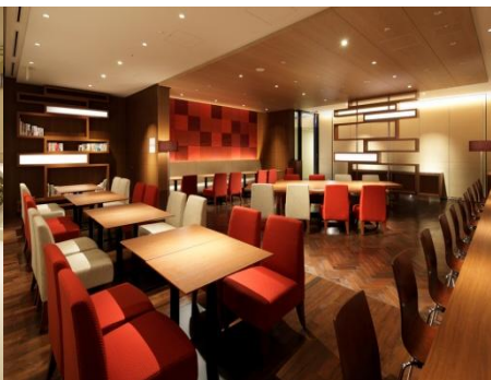
ラウンジ「ノルド リビナ」