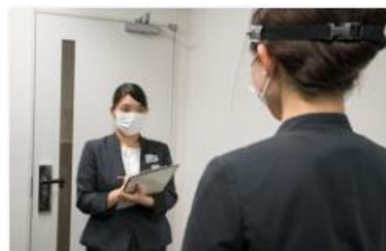
スタッフの体調管理の徹底