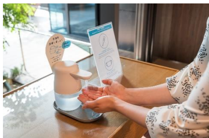
入館、館内施設利用時の検温と消毒