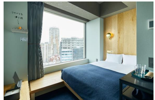
sequence MIYASHITA PARK (MEDIUM DOUBLE)