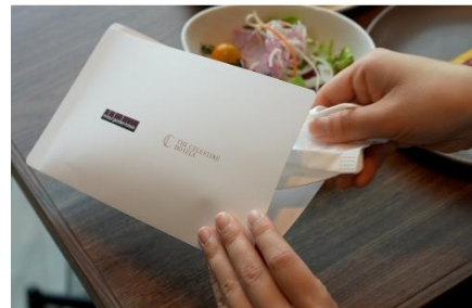
レストラン店内ではマスクケースをご用意