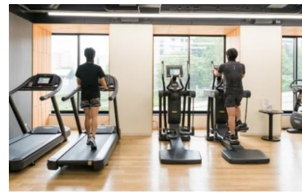
フィットネスなどパブリックスペースの人数制限と消毒の徹底