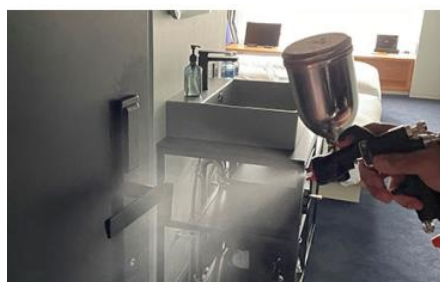
客室内の消毒と抗菌対策の徹底