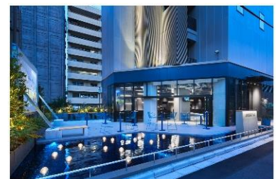
sequence SUIDOBASHI (外観・オープンテラス)