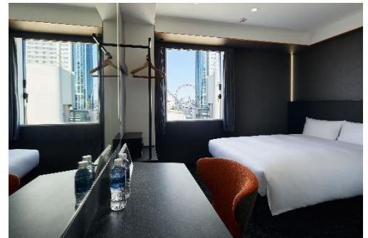
sequence SUIDOBASHI (DOUBLE)

「東京ドーム」、入園無料の遊園地「東京ドームシティ アトラクションズ」、ショップ&レストラン・SPAが集結した商業施設「LaQua」など、多様な施設を有するエンターテインメントシティです。