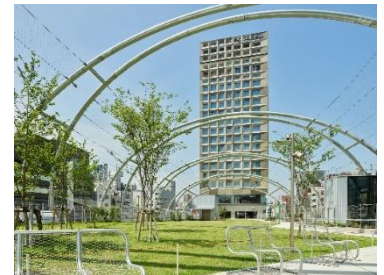
sequence MIYASHITA PARK (外観)