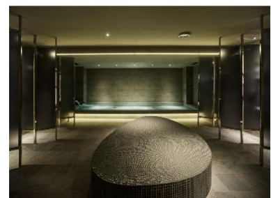
sequence KYOTO GOJO (THE BATH & THE SAUNA)