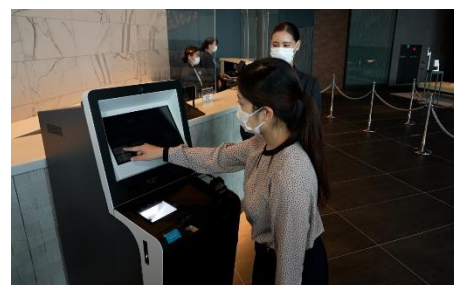
自動チェックイン機導入による接触軽減