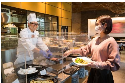
レストラン店内のアクリルボード設置とマスク・手袋着用徹底(ビュッフェ)