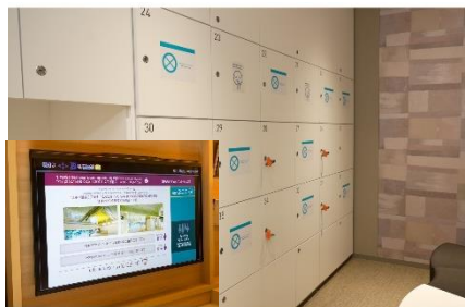
大浴場の利用制限と客室のテレビモニターで利用状況の確認