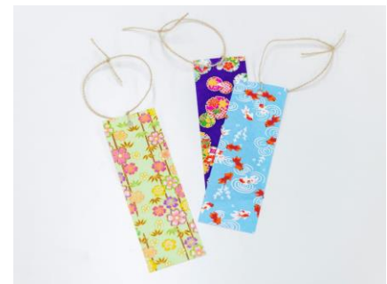
お土産として持ち帰ることも