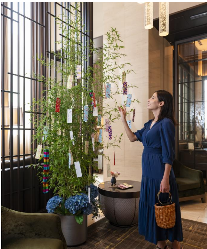
昨年のイベントの様子

ザ セレスティンホテルズ・三井ガーデンホテルズ・sequence にて、夏の風物詩「TANABATA」をお愉しみください。