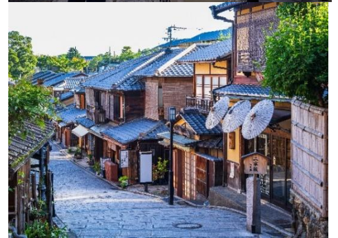
右上：ツアーの様子、右下：二寧坂 ※画像はイメージです