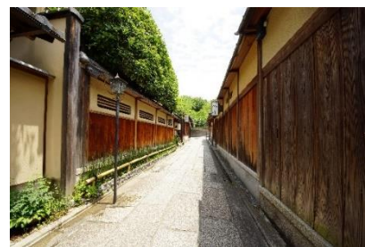
石塀小路 ※画像はイメージです