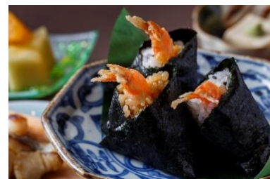
八坂圓堂 名代京風献立（朝食）