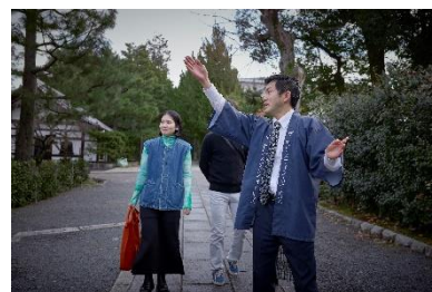
ツアーの様子 ※画像はイメージです