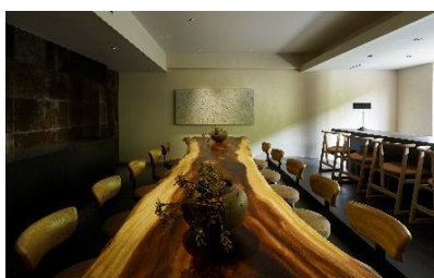
宿泊者専用ラウンジ