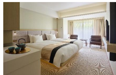
客室（デラックスツイン）

「古代の庭」を望みながら、和モダンな空間の中でゆったりとした時間をお過ごしいただける、宿泊者専用の大浴場もご用意しております。