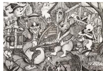
作品名 中央:あじさい(輪島貫太 作)、右下:大きな株(サビー 作)