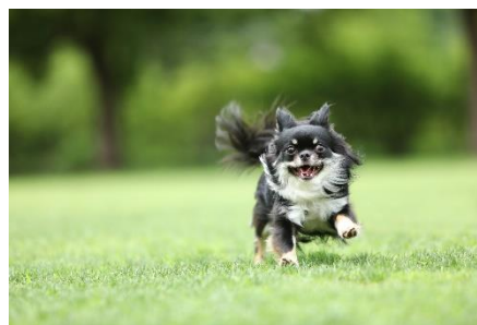
ホテル周辺には愛犬と散歩できる公園も

エキストラベッド 1 台を追加すると最大 4 名、4 匹まで宿泊可能。客室内から出入り自由なテラスにはウッドデッキを設え、愛犬がストレスなく過ごすことができる空間を目指しました。