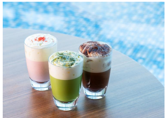
プールサイドで楽しめるホットドリンク