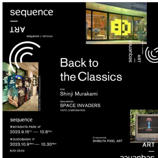
sequence ART | Back to the Classics グラフィック

また、現在開催中の「sequence MIYASHITA PARK」では、9月24日（日）19時よりどなたでもご参加いただける「SHIBUYA PIXEL ARTクローゼイブント」を開催します。ピクセルアートをイメージしたスペシャルドリンクも登場し、よりアートを身近に感じていただける空間を演出します。