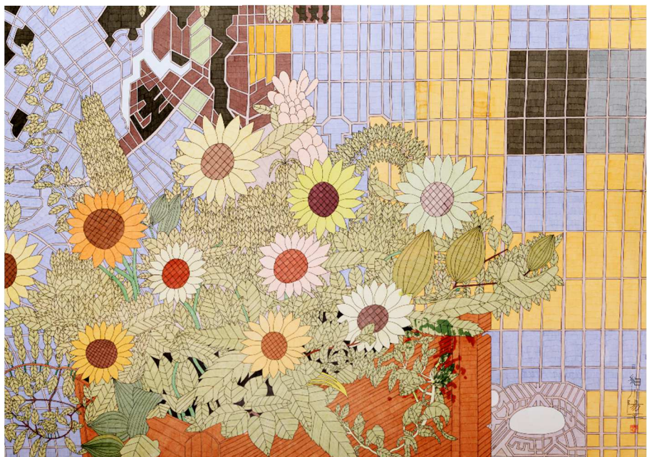
展示作品一例(金沢アート工房 細川 陽平 作「ひまわり」)