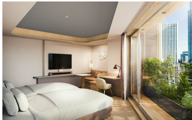
コーナールームイメージパース