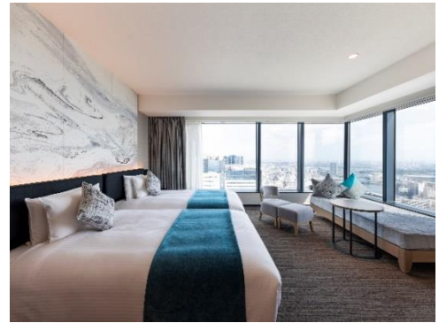
三井ガーデンホテル豊洲プレミア 客室

設置施設:三井ガーデンホテル銀座プレミア ミレニアム 三井ガーデンホテル 東京 三井ガーデンホテル日本橋プレミア 三井ガーデンホテル六本木プレミア 三井ガーデンホテル神宮外苑の杜プレミア 三井ガーデンホテル豊洲プレミア 三井ガーデンホテル名古屋プレミア 三井ガーデンホテル大阪プレミア