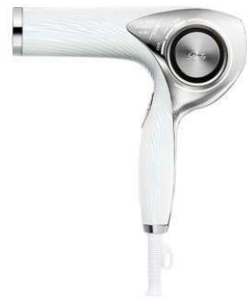
リファビューテックドライヤー プロ

— 本件に関するお問合せ先 — 株式会社三井不動産ホテルマネジメント クオリティマネジメント部 担当：成宮 TEL 03-3548-0337