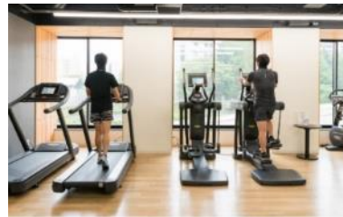
フィットネスなどパブリックスペースの人数制限と消毒の徹底