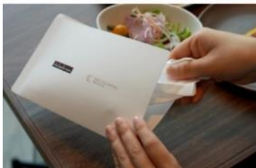
レストラン店内ではマスクケースをご用意