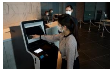
自動チェックイン機導入による接触軽減