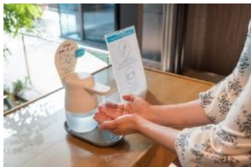
入館、館内施設利用時の検温と消毒