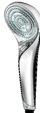
リファファインバブル S