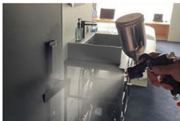
客室内の消毒と抗菌対策の徹底