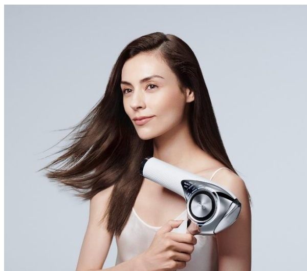
ReFa BEAUTECH DRYER PRO (リファビューテックドライヤープロ)