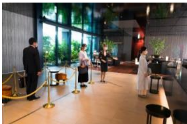
フィジカルディスタンスの確保