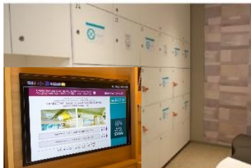
大浴場の利用制限と客室のテレビモニターで利用状況の確認