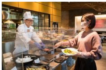
レストラン店内のアクリルボード設置とマスク・手袋着用の徹底(ビュッフェ)