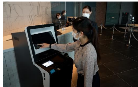
自動チェックイン機導入による接触軽減