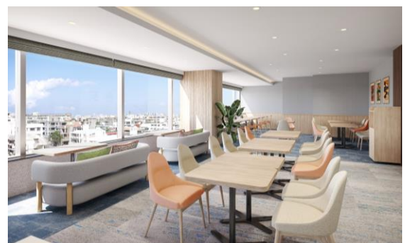
ラウンジサービスを開始したレストラン「コフレール」

10月1日にリニューアルした地上80mの最上階(25階)レストランにて、宿泊者専用のラウンジサービスを提供開始。広島市街と瀬戸内海の島々の景色を一望しながら、ソフトドリンク・アルコール軽食などが時間帯ごとに無料でお楽しみいただける宿泊者専用のゲストラウンジを兼ねた空間として、新たに生まれ変わりました。