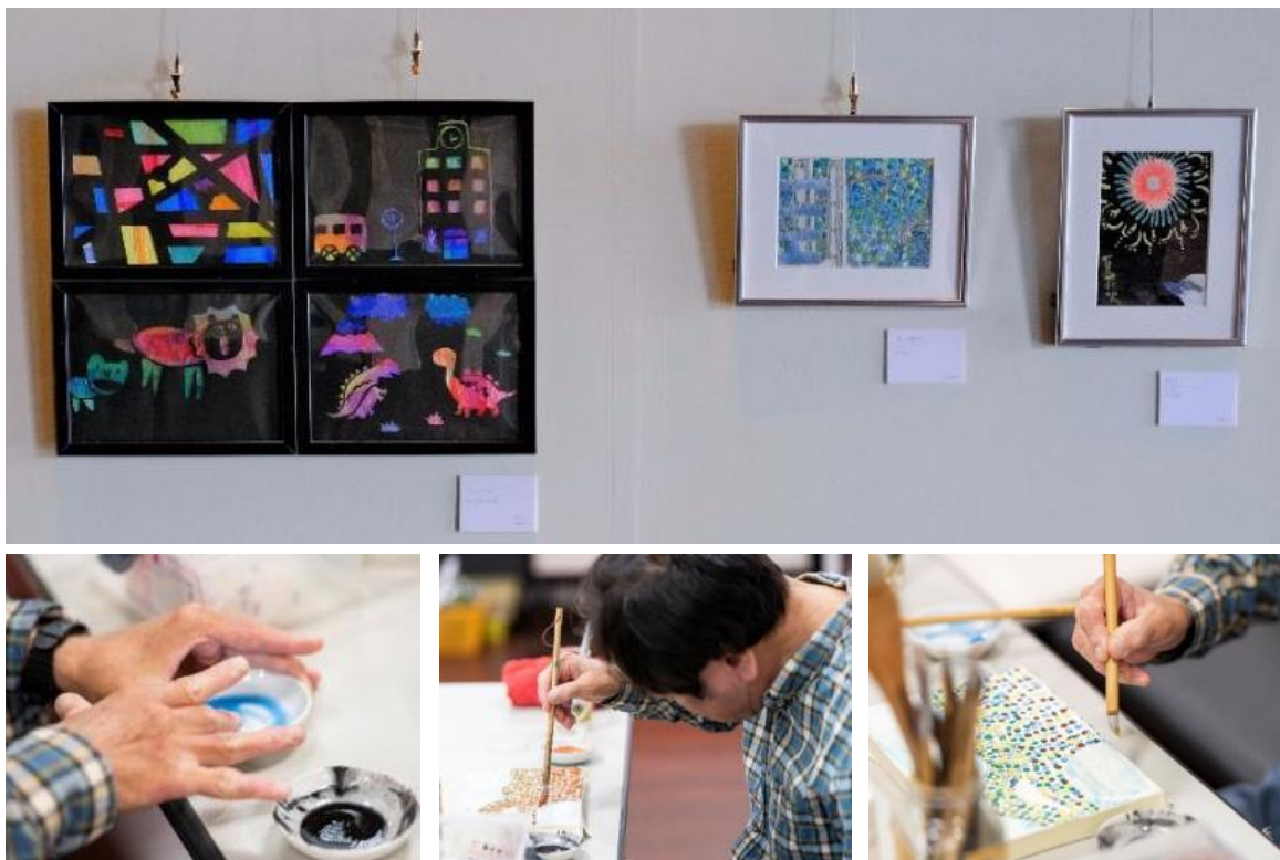
作品展示と制作風景