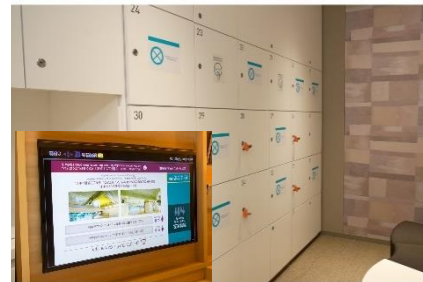
大浴場の利用制限と客室のテレビモニターで利用状況の確認