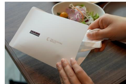
レストラン店内ではマスクケースをご用意