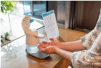
入館、館内施設利用時の検温と消毒