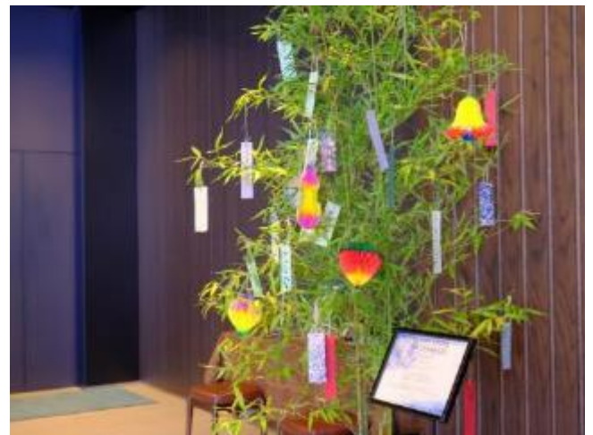
七夕イベントの様子 (三井ガーデンホテル日本橋プレミア)

※三井ガーデンホテル仙台は 2022 年 7 月 5 日より 8 月 10 日に開催 ※撮影時のみマスクを外しています