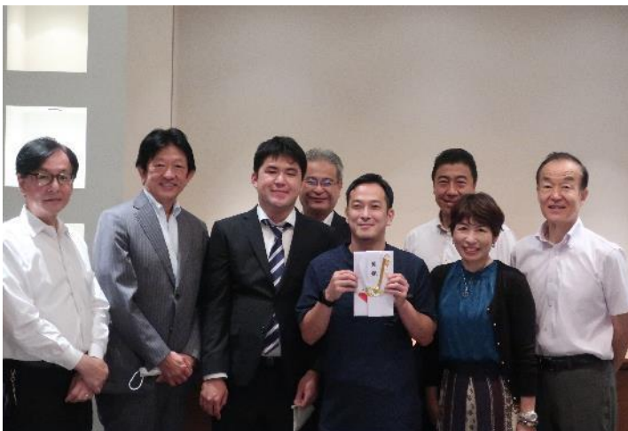
贈呈式の様子 (ホテル ザ セレスティン東京芝)