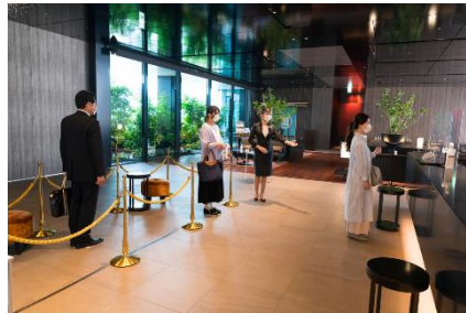
フィジカルディスタンスの確保