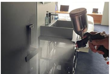
客室内の消毒と抗菌対策の徹底