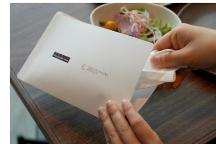
レストラン店内ではマスクケースをご用意