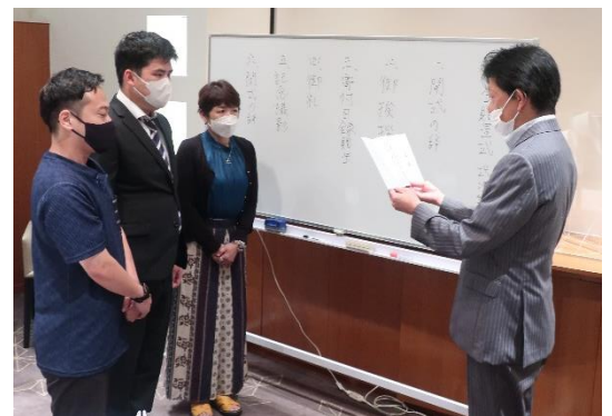
贈呈式の様子 (ホテル ザ セレスティン東京芝)

【贈呈式】 2022年8月23日(火) 10:30～11:00 会場: ホテル ザ セレスティン東京芝 セレスティンダイニング ラ ブルーズ東京