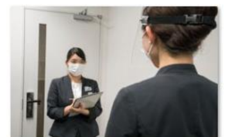
スタッフの体調管理の徹底

株式会社三井不動産ホテルマネジメントが運営する「ザ セレスティンホテルズ」「三井ガーデンホテルズ」「sequence」におきましては「新オペレーションガイドライン」の策定にあたって、衛生および感染防止ソリューションをグローバルで牽引するエコラボ社による信頼性の高いノウハウと科学的アプローチを清掃手順・衛生管理に取り入れております。