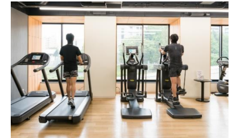
フィットネスなどパブリックスペースの人数制限と消毒の徹底