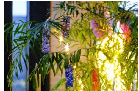
館内の七夕装飾 (三井ガーデンホテル五反田)

＜三井ガーデンホテルズ＞ 三井ガーデンホテル銀座プレミア ミレニウム 三井ガーデンホテル 東京 三井ガーデンホテル日本橋プレミア 三井ガーデンホテル六本木プレミア 三井ガーデンホテル神宮外苑の杜プレミア 三井ガーデンホテル大手町 三井ガーデンホテル京橋 三井ガーデンホテル銀座五丁目 三井ガーデンホテル汐留イタリア街 三井ガーデンホテル上野 三井ガーデンホテル五反田 三井ガーデンホテル豊洲ベイサイドクロス 三井ガーデンホテルプラナ東京ベイ 三井ガーデンホテル仙台