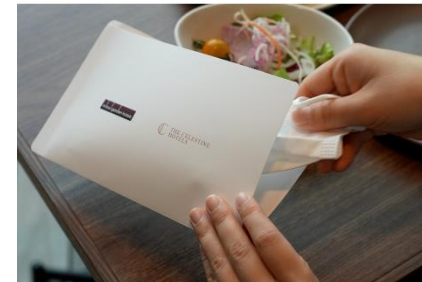
レストラン店内ではマスクケースをご用意