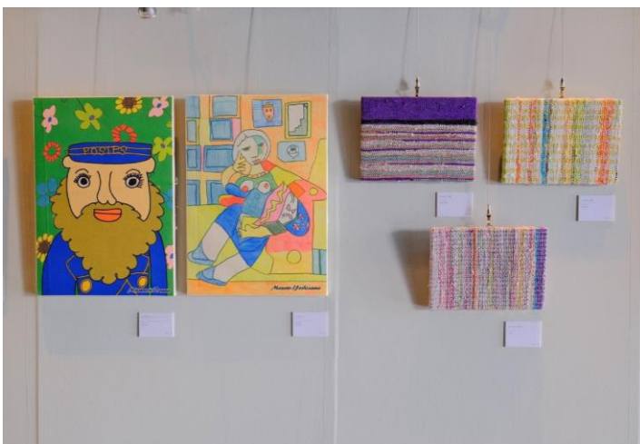
パラアート(イメージ)