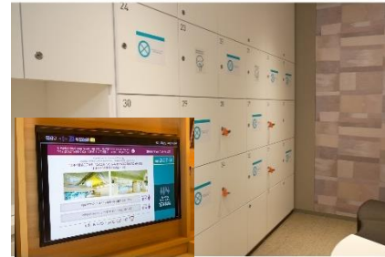
大浴場の利用制限と客室のテレビモニターで利用状況の確認