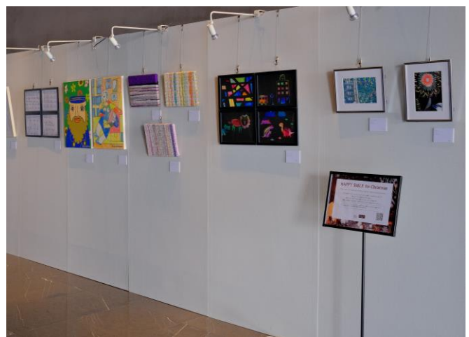
会場イメージ(三井ガーデンホテル銀座プレミア ロビー)