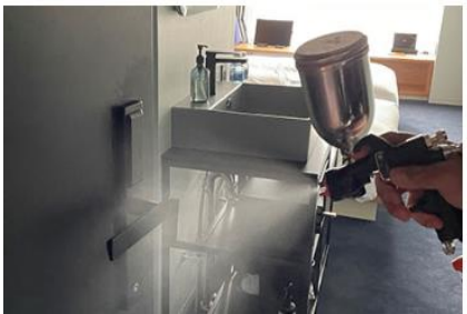
客室内の消毒と抗菌対策の徹底