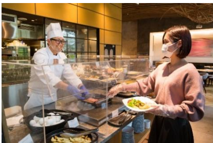
レストラン店内のアクリルボード設置とマスク・手袋着用の徹底(ビュッフェ)