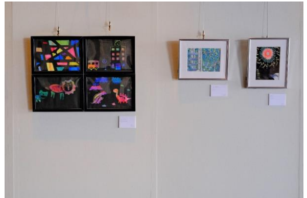
パラアート(イメージ)