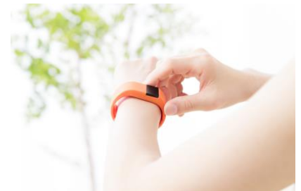
センシングデバイス(イメージ)