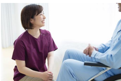
ケアスタッフ(イメージ)

次回の診療日に合わせてホテル予約をスムーズに取れるように、NCC東病院内に本ホテル専用の予約ブースを設置予定。ホテル予約時のご負担を減らします。