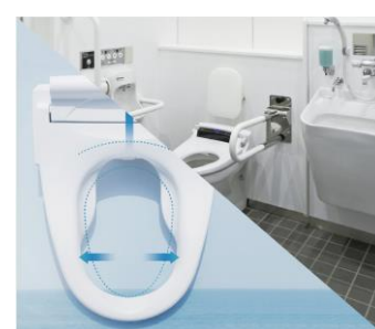
オストメイト対応トイレ(イメージ)