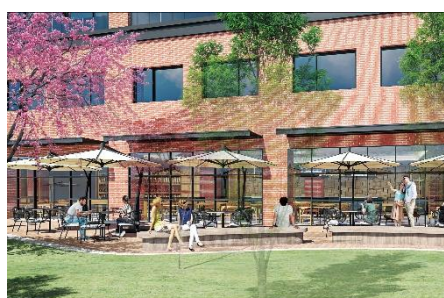
レストランテラス(イメージ)