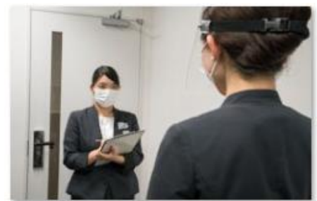
スタッフの体調管理の徹底