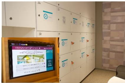
大浴場の利用制限と客室のテレビモニターで利用状況の確認