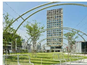
sequence MIYASHITA PARK (外観)

所在地 : 東京都渋谷区神宮前6-20-10 MIYASHITA PARK North 客室数 : 240室