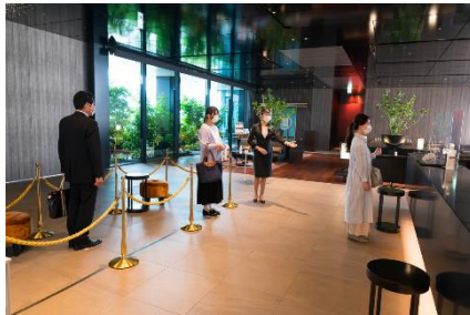
フィジカルディスタンスの確保