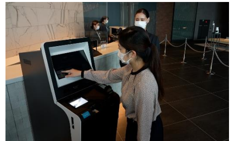
自動チェックイン機導入による接触軽減