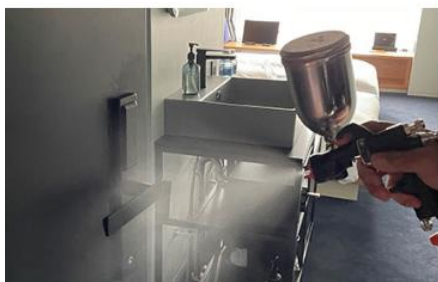
客室内の消毒と抗菌対策の徹底