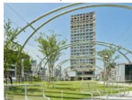
sequence MIYASHITA PARK