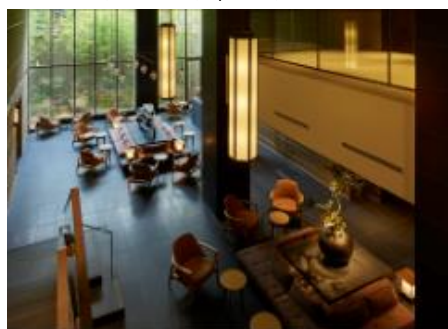
ホテル ザ セレスティン京都祇園