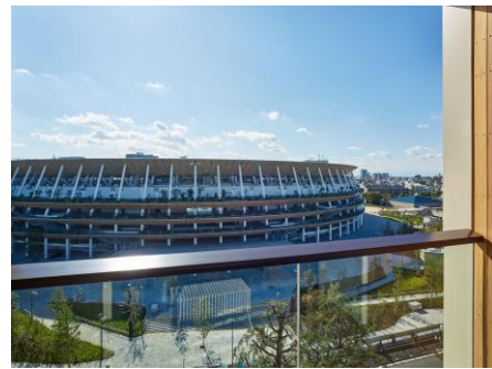
三井ガーデンホテル神宮外苑の杜プレミア モデレートツイン(バルコニー)

フィジカルディスタンスは取りながらも、「人と人の繋がり」は近くなれるよう、少人数でのお食事を安心して楽しめる場として「ホテルの客室」をご利用いただけるデイユースプランをご用意しました。