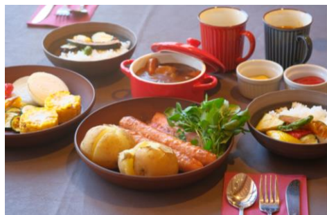
スタンダードキャンプセット

スタンダードキャンプセット 2,000円(2名様分、税込) 骨付きチキンキャンプセット 3,000円(2名様分、税込) シーフードキャンプセット 4,000円(2名様分、税込)