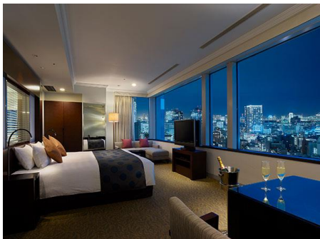
ホテル ザ セレスティン東京芝 エグゼクティブコーナーツイン