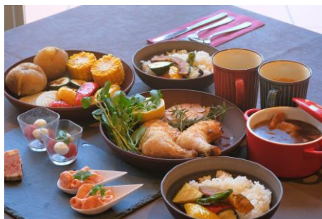
骨付きチキンキャンプセット