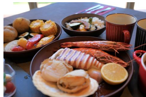
シーフードキャンプセット