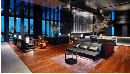
三井ガーデンホテル日本橋プレミア