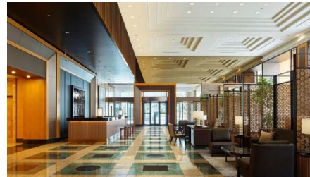
ホテル ザ セレスティン東京芝