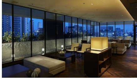
三井ガーデンホテル大阪プレミア