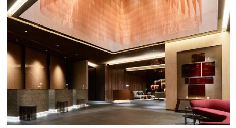
三井ガーデンホテル六本木プレミア