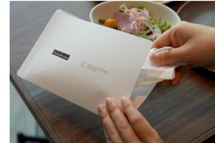
レストラン店内ではマスクケースをご用意