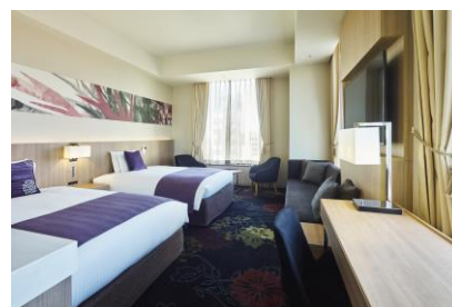
客室(デラックスコーナーツイン)

※ ナイトウェアは客室常設アイテムです。お持ち帰りいただく事はできません。購入希望の方はフロントまでお問合せください。