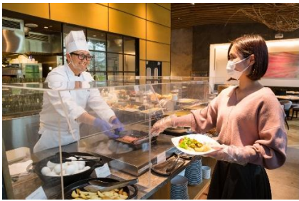
レストラン店内の亚克力ボード設置とマスク・手袋着用徹底(ビュッフェ)