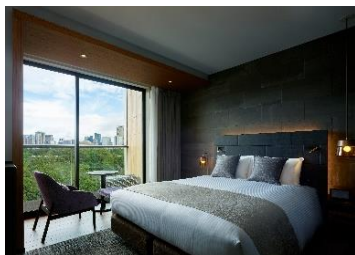
客室(モデレートクイーン)