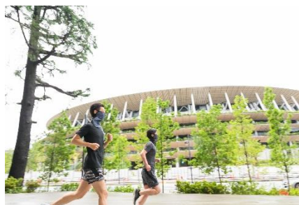
三井ガーデンホテル神宮外苑の杜プレミア前(エントランス前)