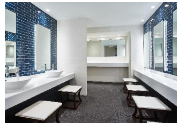
大浴場(パウダールーム)