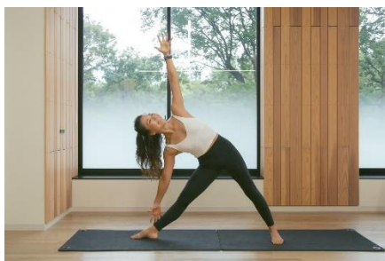
杜のヨガ(イメージ)