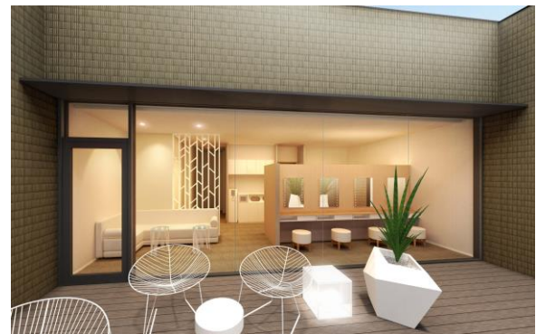
女性専用パウダールーム