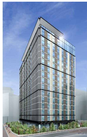
三井ガーデンホテル五反田 (完成予想パース)