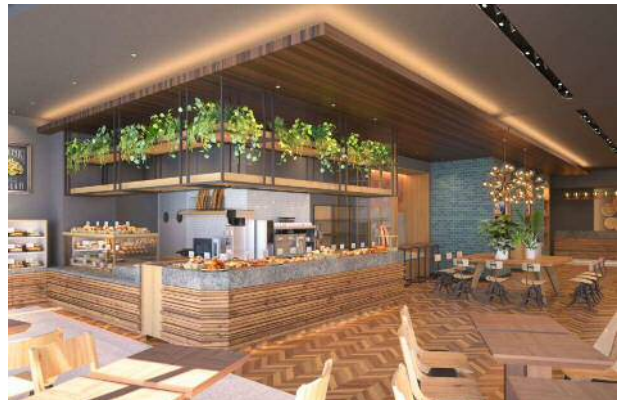
ベーカリーカフェ・レストラン（イメージCG）