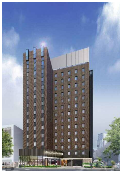
三井ガーデンホテル大手町 (完成予想パース)

現在、三井ガーデンホテルズは、日本全国で20施設・5,337室を運営しておりますが、両2ホテルの開業により、22施設・5,898室となる予定です。今後も大都市圏や地方政令指定都市を中心に積極的に新規展開を行うとともに、ワンランク上の宿泊主体型ホテルとして「お客様の五感を満たすホテル」、「記憶に残るホテル」を目指し、ホスピタリティ溢れるサービスの提供に努めてまいります。