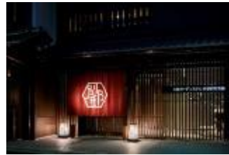
京都新町 別邸:エントランス