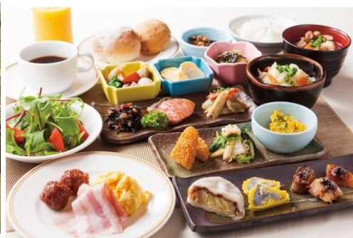
朝食1名盛イメージ