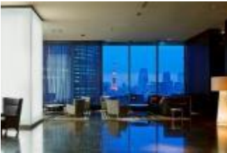
銀座プレミア:ロビー

三井不動産ホテルマネジメントグループは、三井ガーデンホテルズを全国に20ホテル(5,337室)・セレスティンホテル(東京芝)を運営しております。2017年には新ブランド「ザ セレスティンホテルズ」を展開し、9月には「ホテル ザ セレスティン祇園」、10月には「ホテル ザ セレスティン銀座」を開業、今秋、セレスティンホテル(東京芝)をリブランドオープンいたします。また、2018年には東京の日本橋・東五反田・大手町に三井ガーデンホテルを開業し、グループ運営客室数が6,400室超となる予定です。「記憶に残るホテル」「感性豊かなお客様の五感を満たすホテル」という理念・ホテルコンセプトのもと、デザイン性の高さと機能性を備えた滞在空間に、ホスピタリティ溢れるサービスを提供しています。