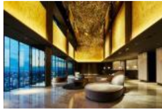
名古屋プレミア:ロビー