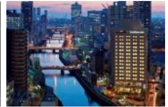
大阪プレミア:外観