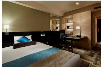
汐留イタリア街:モデレートシングル