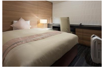
上野:レディースルーム