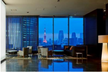
銀座プレミア:ロビー

今年で三井ガーデンホテル大阪淀屋橋の開業から31周年を迎える三井ガーデンホテルズは、全国で17ホテル(4,480室)を運営しており、今年12月に銀座に2店舗目を、2016年に名古屋に開業し、チェーン運営客室数が5,000室超となる予定です。「記憶に残るホテル」「感性豊かなお客様の五感を満たすホテル」という理念・ホテルコンセプトのもと、デザイン性の高さと機能性を備えた滞在空間に、ホスピタリティ溢れるサービスを提供する「ワンランク上の宿泊主体型ホテル」として展開しています。