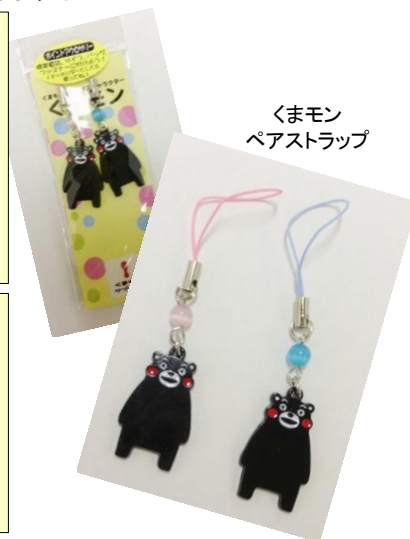
くまモン ペアストラップ