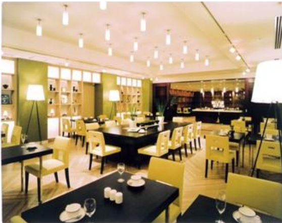
レストラン「ガーデンカフェ」

朝食では和洋約25種類のビュッフェに加え、熊本の郷土料理コーナーを設けています。「だご汁」「馬肉ホルモン」「いきなり団子」「阿蘇田楽」「阿蘇高菜」「辛子れんこん」「南関あげの菜焼き」など、さまざまな献立をご用意しています(内容は季節により異なります)。*朝食 お一人様 ¥1,050(税込)