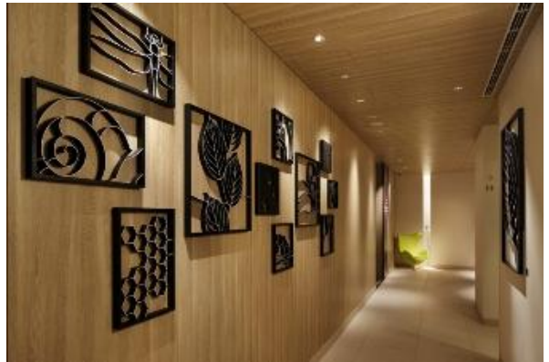
1階通路(アート作品)