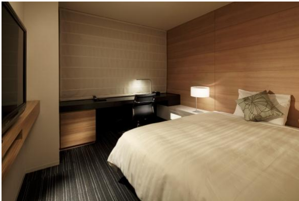
スーペリアルーム