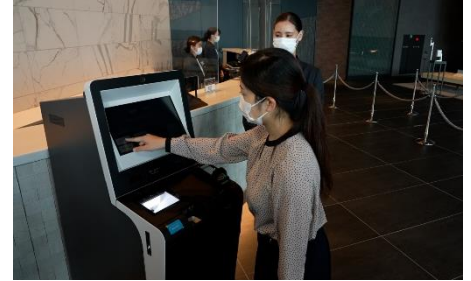
自動チェックイン機導入による接触軽減