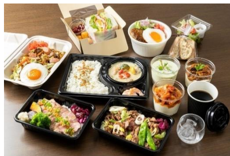
上 : 鹿児島黒毛和牛カシ米尔カレー 右上 : 伝統のカシ米尔カレー 右下: テイクアウトメニュー