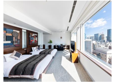
客室(エグゼクティブコーナーツイン「つむぎ」)

東京都港区芝、薩摩藩の江戸屋敷跡に立地。「CROSS OVER TOKYO」をコンセプトに江戸と薩摩の記憶が息づく館内。メインダイニングやバー&ラウンジでは鹿児島食材を取り入れたメニューを提供しています。また光と緑あふれる宿泊者専用ラウンジ&パティオやスパ施設、大きな窓の客室で、大人たちが心からくつろぎ、情緒に包まれた上質な滞在をお楽しみいただけるホテルです。