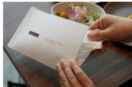
レストラン店内ではマスクケースをご用意