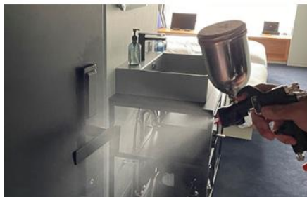
客室内の消毒と抗菌対策の徹底