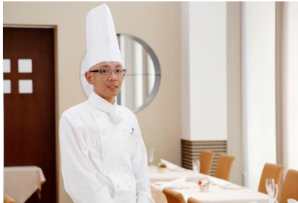
元小出総料理長 メインダイニング「ラブルーズ東京」