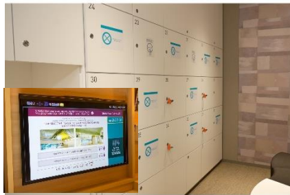
大浴場の利用制限と客室のテレビモニターで利用状況の確認