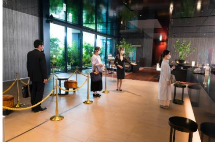
フィジカルディスタンスの確保