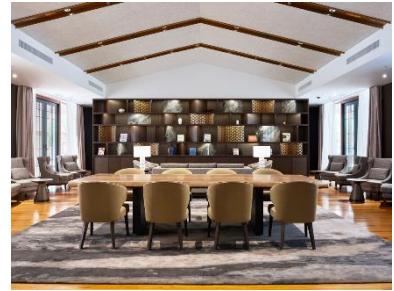
宿泊者限定ラウンジ

「ホテル ザ セレスティン東京芝」公式サイト https://www.celestinehotels.jp/tokyo-shiba/