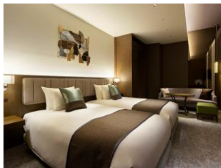
ホテル ザ セレスティン銀座 客室