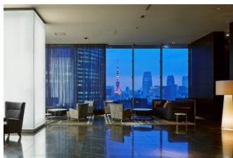
三井ガーデンホテル銀座プレミア ロビー

「記憶に残るホテル」「感性豊かなお客様の五感を満たすホテル」という理念・ホテルコンセプトのもと、デザイン性の高さと機能性を備えた滞在空間に、ホスピタリティ溢れるサービスを提供しています。