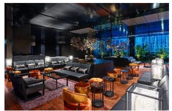
三井ガーデンホテル日本橋プレミア ロビー