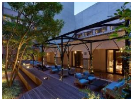
14F 宿泊者専用パティオ