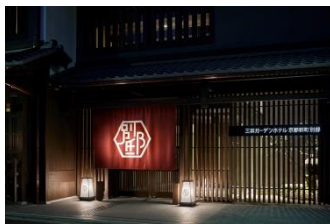
三井ガーデンホテル京都新町 別邸 エントランス