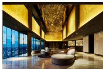
三井ガーデンホテル名古屋プレミア ロビー