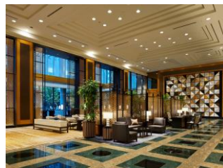
ホテル ザ セレスティン東京芝 ロビー