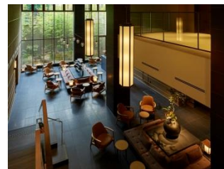
ホテル ザ セレスティン京都祇園 ロビー