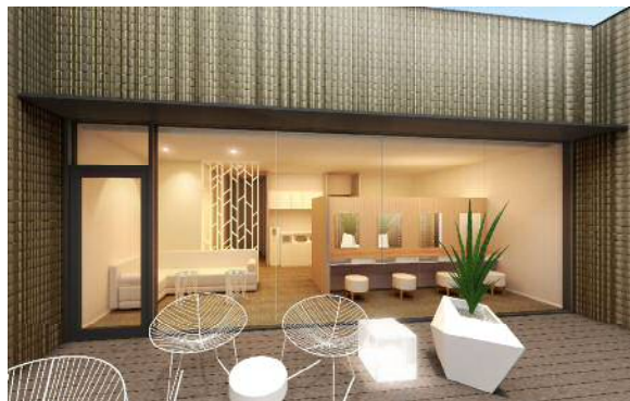
女性専用パウダールーム