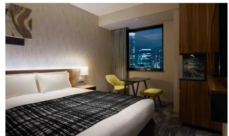
客室（コンフォート）