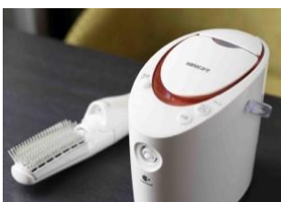
パナソニック製 美容ケア家電

上層階には「レディースルーム」をご用意。女性に人気のパナソニック製美容ケア家電やポーラ化粧品製のアメニティを設置しています。女性大浴場は、タイルや壁面を明るい色調で統一するとともに、併設のパウダールームもゆったりと設計し、細部の快適さにもこだわりました。