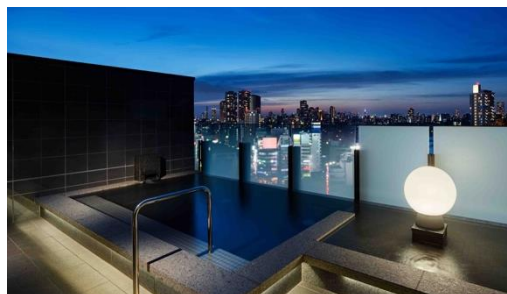
展望露天風呂(男性・外湯)