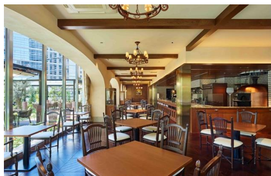
レストラン「タント タント ザ ガーデنز」

また、ランチ・ディナータイムには厳選素材にこだわったボリュームたっぷりのイタリア料理&種類豊富なワインを味わっていただけます。