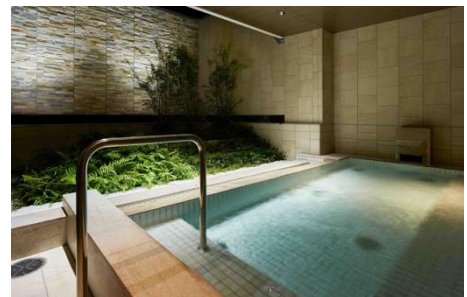
大浴場（女性・外湯）