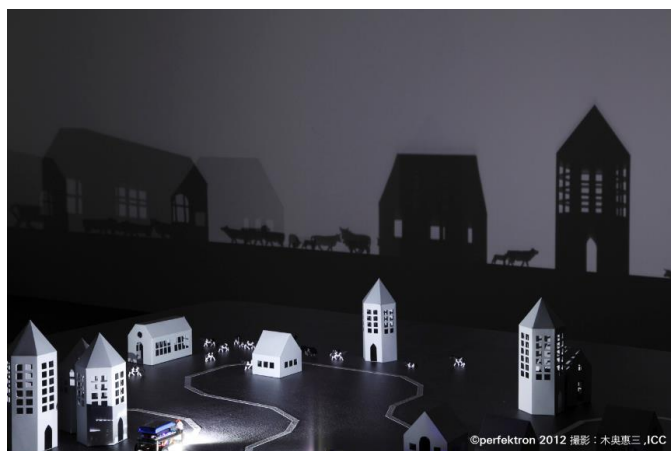
「cocosocoasocoここそこあそこ」2006.12～2007.01 cocosocoasoco（個展）LucyMackintoshGarally, （ローザンヌ スイス）