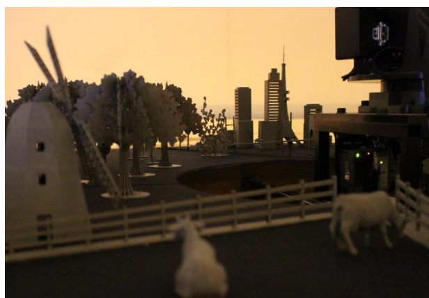
プラナツリーの上部に置かれたミニチュア模型。 光があたると、数十倍の大きさの影となって動き出す。