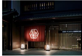
京都新町 別邸:エントランス