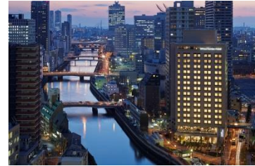
大阪プレミア:外観