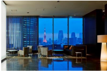
銀座プレミア:ロビー

三井ガーデンホテルズは、全国で18ホテル(4,809室)を運営しており、2016年に京橋(東京)・名古屋に開業し、チェーン運営客室数が5,000室超となる予定です。「記憶に残るホテル」「感性豊かなお客様の五感を満たすホテル」という理念・ホテルコンセプトのもと、デザイン性の高さや機能性を備えた滞在空間に、ホスピタリティ溢れるサービスを提供する「ワンランク上の宿泊主体型ホテル」として展開しています。