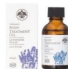
「生活の木」 トリートメントオイル ラベンダーリラックス