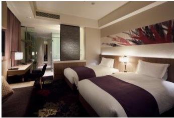
ミレニアム東京:デラックスツイン