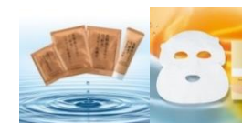
ヤクルト基礎化粧品5点セット