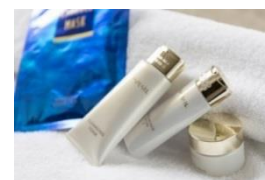
MIKIMOTOスキンケア4点セット

[洗顔フォーム・モイスチャーリッチローション・バイタライジングクリーム・ 美容マスク] ※1滞在につき1セット