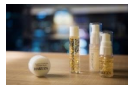
箔座 金箔コスメティックスの特別ギフト