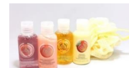
BODY SHOPミニサイズ バス&ボディケア4本セット