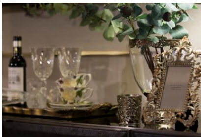
ティーカップ／グラス