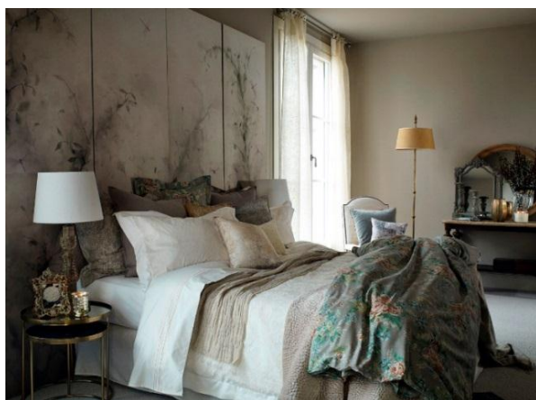
ZARA HOMEコンセプト(イメージ)