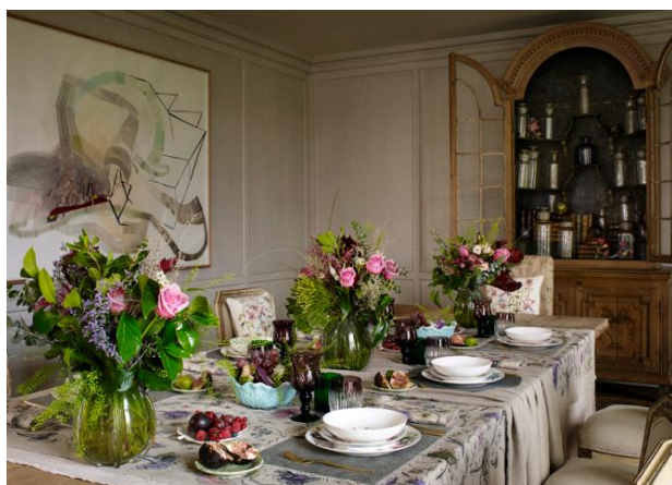
ZARA HOMEコンセプト(イメージ)

商品の約70%はベッドリネンやバス、テーブル用のホームテキスタイルですが、ZARA HOMEではテーブルウェアやカトラリーをはじめ、ルームウェアやギフトアイテムなど家庭用雑貨も取り扱っております。2003年のブランド創立ながら既に国際的に存在感を高めており、現在45カ国に400店舗以上を展開しています。週2回新作を投入しながらインテリアの最新のトレンドをお届けしています。ユニークなビジョンのもとデザイナーも国際色豊かなメンバーをそろえ、ZARA HOMEは室内を温かく、ファッショナブルな空間にする様々なご提案をしています。