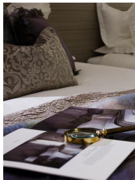
ZARA HOMEルーム(実際の写真)