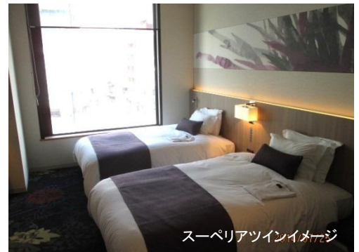
スーパーアツインイメージ

・小さいタイプの客室でも20㎡・ベッド幅1,600mmとし、2人でもゆったりとご宿泊いただけるゆとりあるプランとしています。