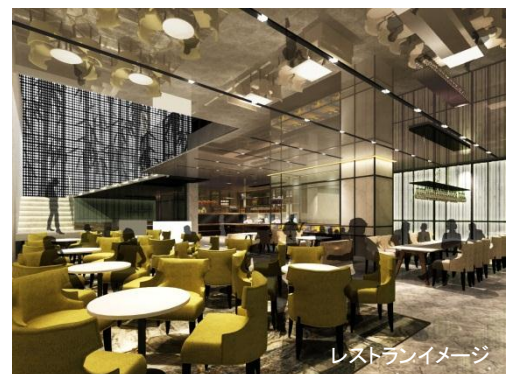
レストランイメージ

・ランチやディナーだけでなくティータイムやバータイムも営業し、一日を通してホテルゲストだけでなく、銀座に来られる幅広いお客様に対応しています。