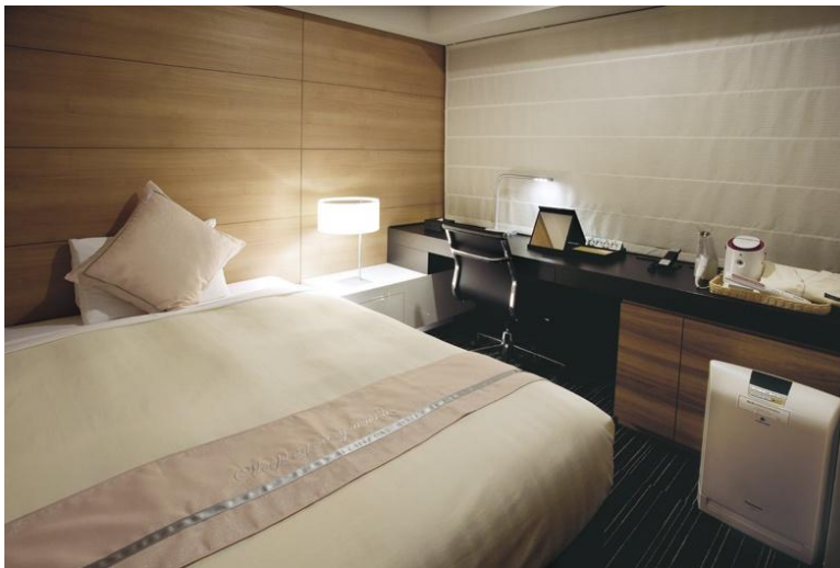
都会的モダン空間にウェルカムの気持ちをラグジュアリーなベッドスローとクッションでアレンジした「新レディースルーム」。大人の女性、働く女性の、日常を超えた空間をご提供いたします。

三井ガーデンホテルでは、近年女性のお客様の利用率が向上しており、本年4月～7月の全国16ホテル平均利用率が約35%と、2年前の2009年度平均に比べ約10ポイント増加しています。これを受け更に増加するニーズに対応すべく、チェーン全体として取り組んでいます。今後も女性の視点でのおもてなしを目指し、様々なプランをご提供していきたいと考えております。