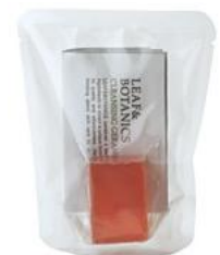
スキンケアセット