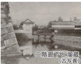
二階廊下と溜蔵 (古写真)

徳川家康による創建の後、寛永の大改築、明治期の離宮としての改装を経て今に伝わっています。京都市に下賜された後は、昭和24年～30年に大規模な維持修理が行われましたが、既に50年以上が経過し、壁や屋根をはじめとして大きな傷みが見られます。