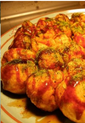
大阪淀屋橋「たこ焼き」