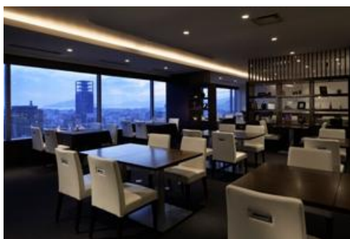
レストラン「コフレール」

■三井ガーデンホテル広島(281室) 住所:〒730-0037 広島市中区中町9-12 電話:082-240-1131 交通:JR「広島」駅より車で7分 バスセンターより徒歩10分 施設:1階 フロント・カフェ・美容室 2階 日本料理 八雲・ギャラリー 3階 宴会場 4～24階 客室 25階 レストラン「コフレール」